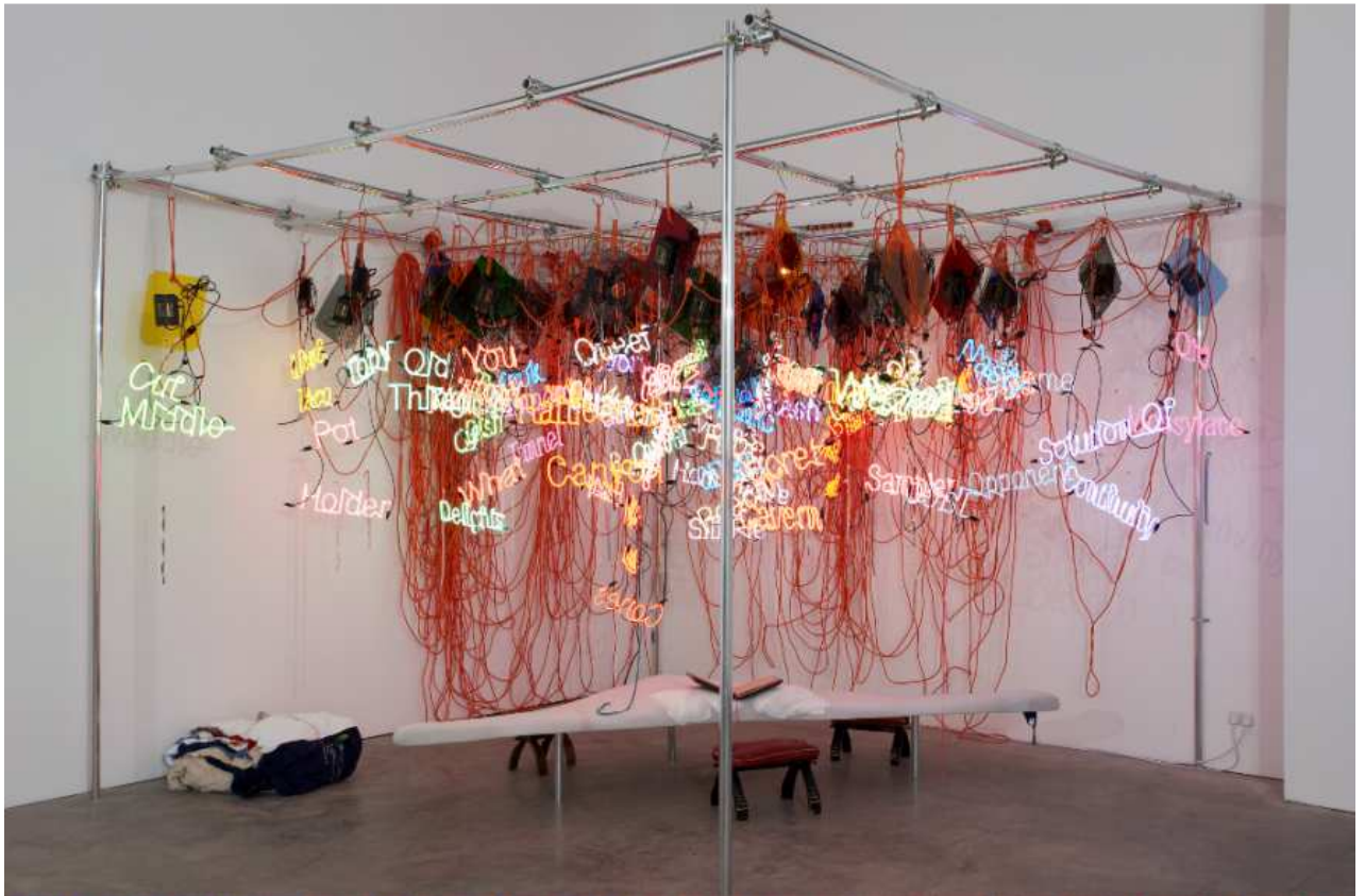
Jason Rhoades, Sans titre , 2004