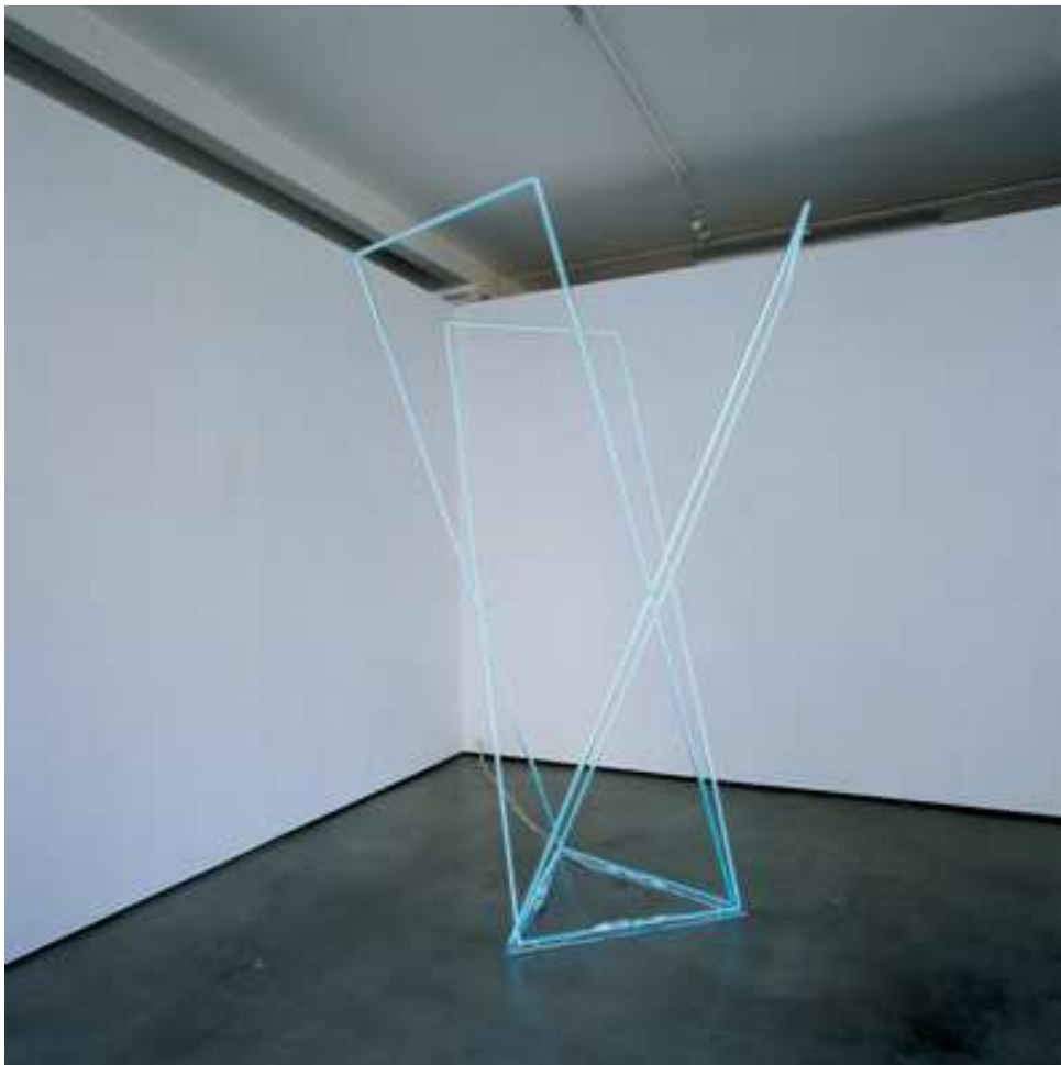
François Morellet, Néon dans l'espace , 1969/96