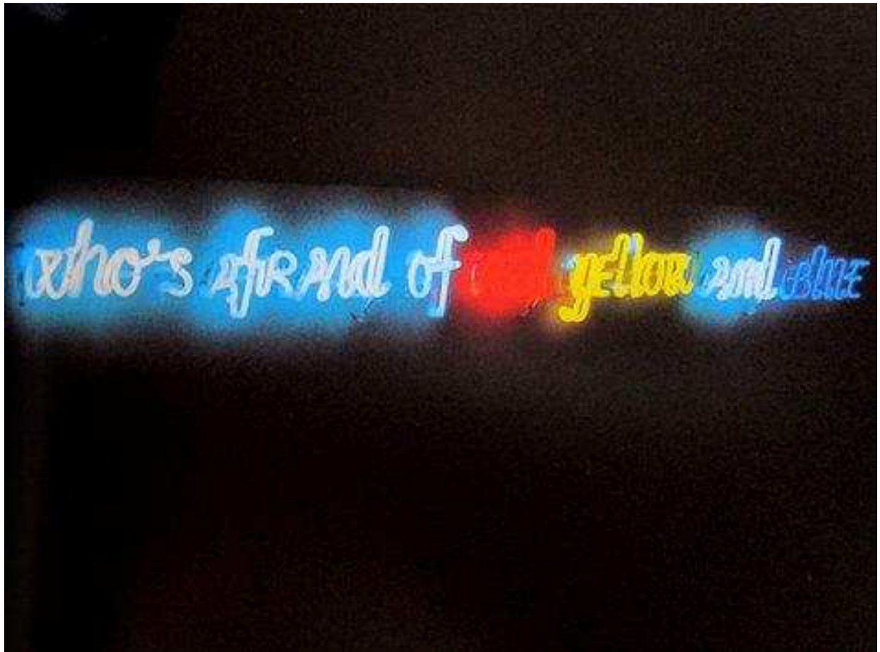
Maurizio Nannucci, Who's afraid of red yellow and blue? , 1970

vernissage jeudi 16 février de 18h à 21h