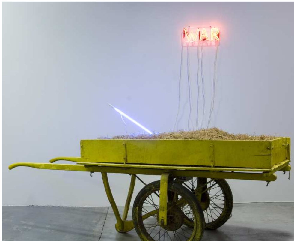
Bruce Nauman, RAW/WAR , 1970 Mario Merz, Chère charrette , 1978