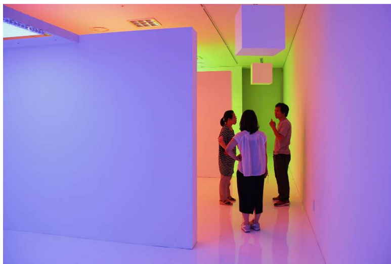
Carlos Cruz-Diez, Chromosaturación , 2011

Exposition " Cruz-Diez. Color in Space ", Dream Forest Arts Center, Sang Sang Tok Tok Gallery, Séoul (Corée du Sud), 2011