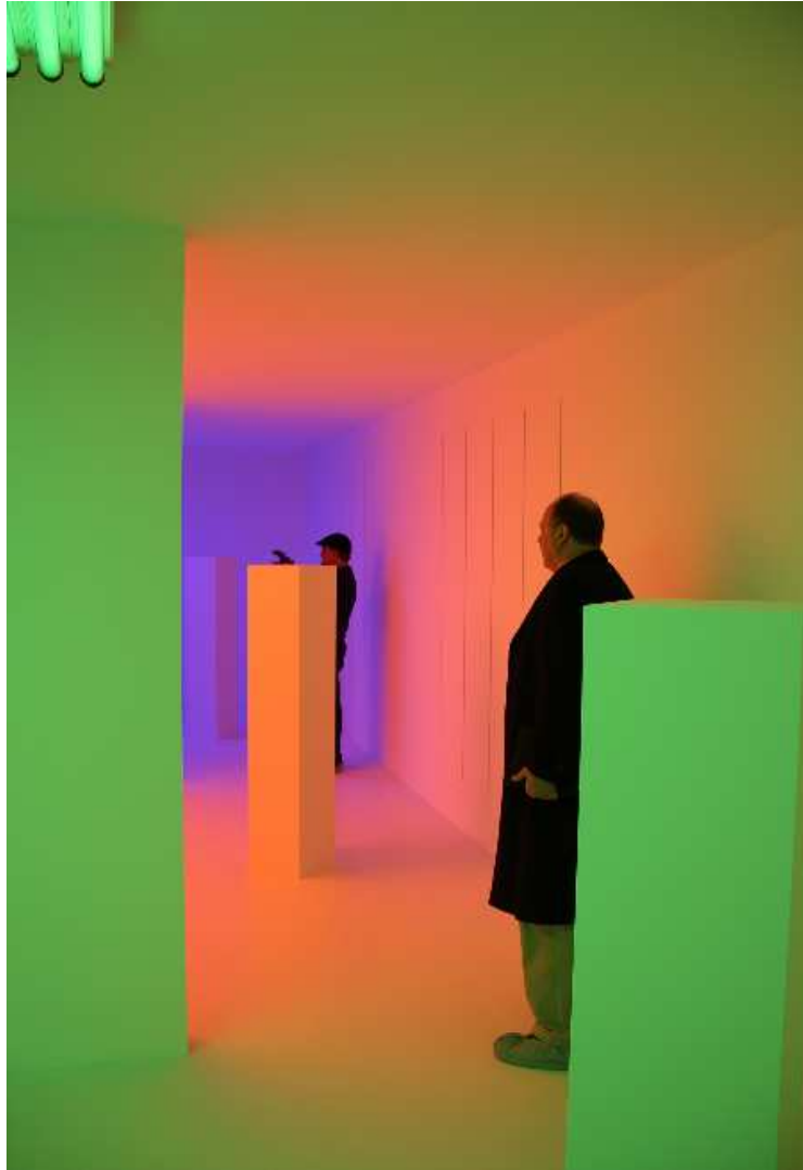
Carlos Cruz-Diez, Chromosaturación , 2011

Exposition " Carlos Cruz-Diez : Color in Space and Time ", Museum of Fine Arts, Houston (États-Unis), 2011