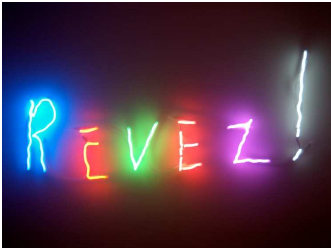
Claude Lévêque, Rêvez! , 2008 © ADAGP/Claude Lévêque, Courtesy de l'artiste et Kamel Mennour, Paris