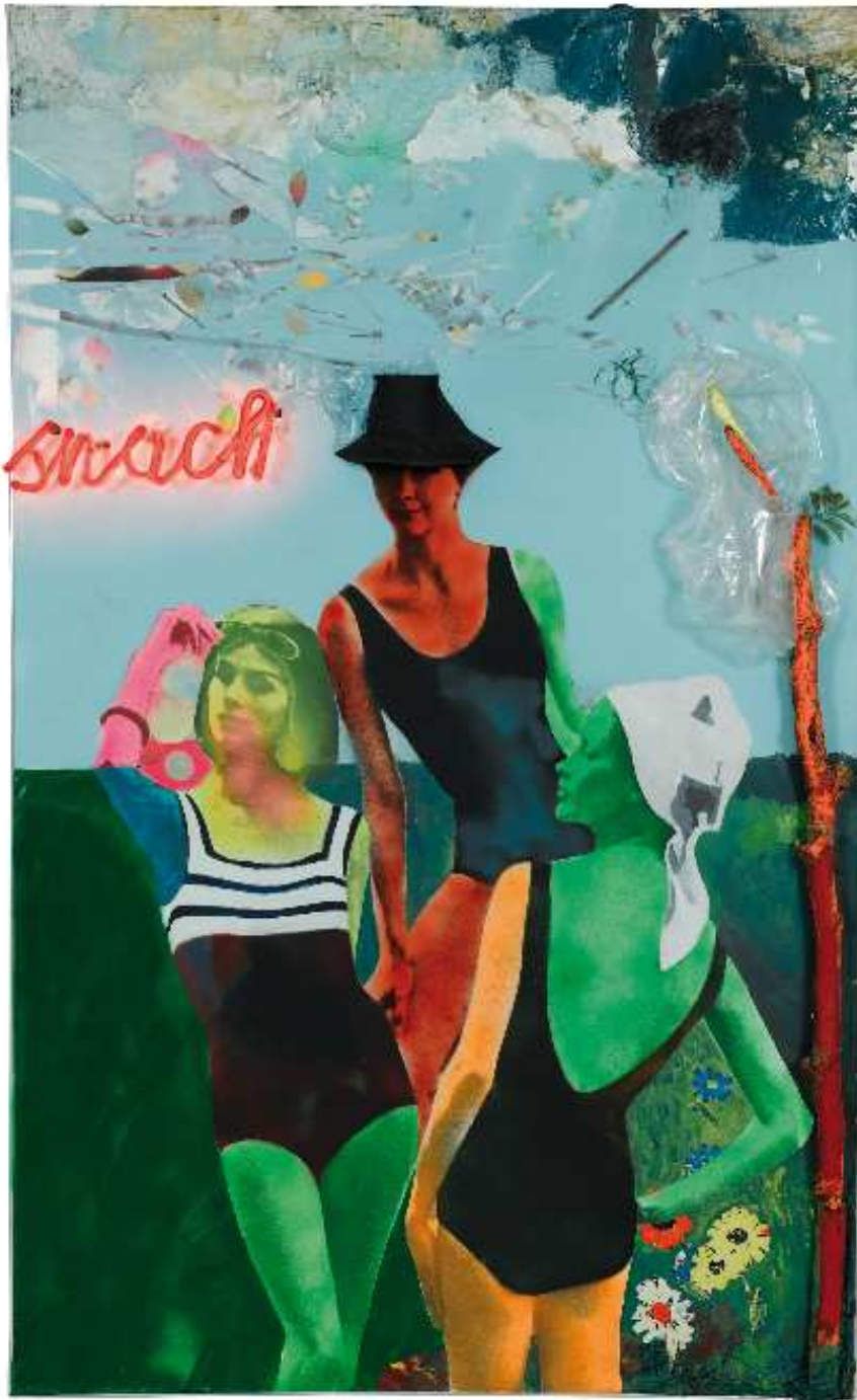
Martial Raysse, Snack , 1964

Photo : Art Digital Studio © 2009 Martial Raysse / ADAGP