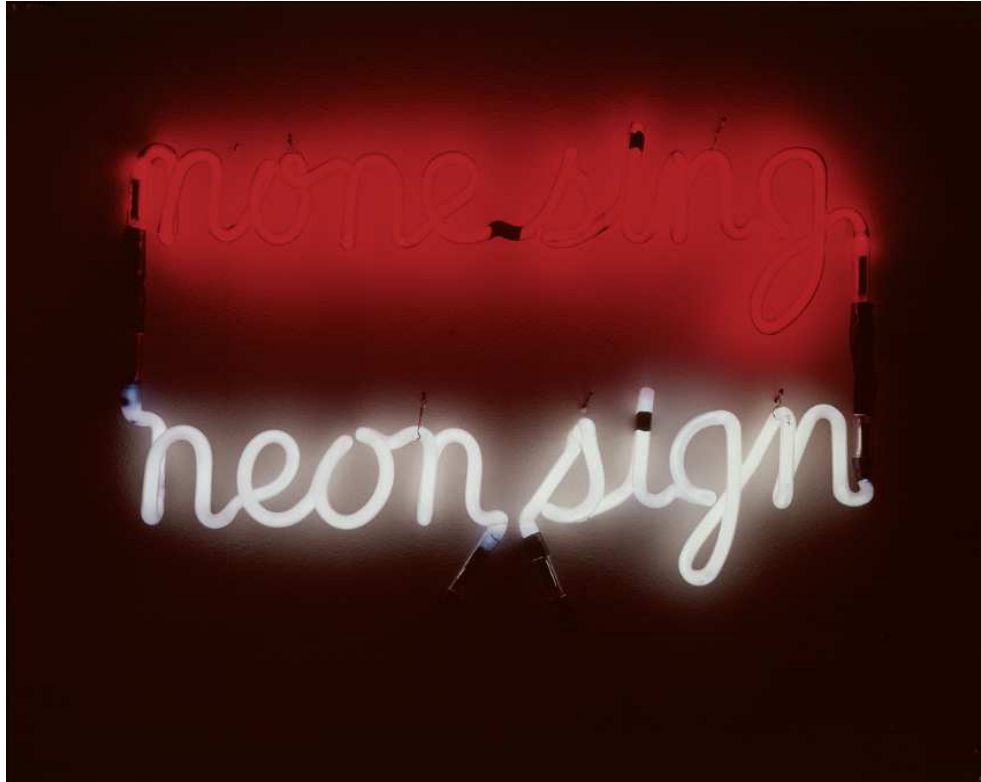
Bruce Nauman, None Sing Neon Sign , 1970 Courtesy Collection Sylvio Perlstein, Anvers – Droits réservés